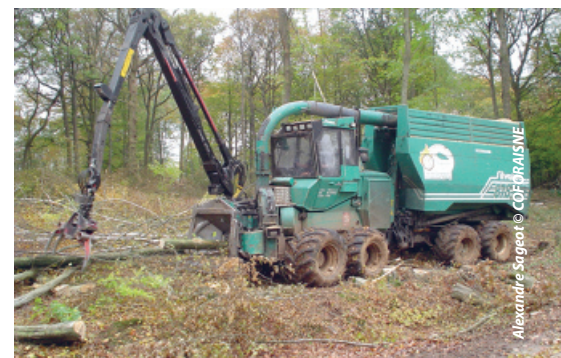
Récolte de bois énergie en forêt