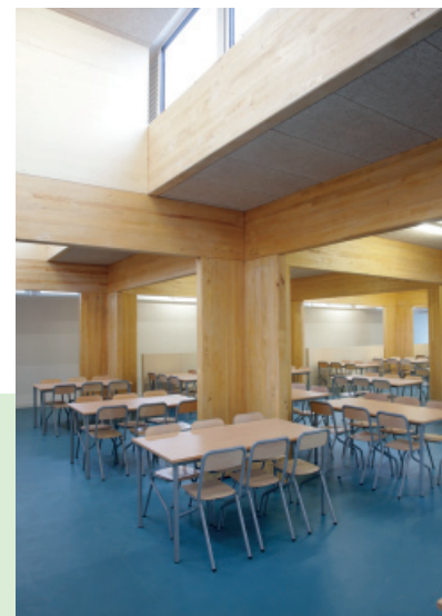
Le restaurant scolaire Léon Jouhaux à Lille, réalisé sur la base d'une structure poteaux poutre en peuplier, également en respectant les principes de l'architecture bioclimatique et les exigences d'un bâtiment passif en énergie. Celui-ci a nécessité 27,7m 3 de peuplier lamellé-collé pour une surface de 378 m 2 .

En attendant la prochaine visite, vous pouvez découvrir ces constructions bois à travers nos « brochures vitrines » dans notre espace ressources : bois-et-vous.fr/ressources (thématique « Bois construction »).