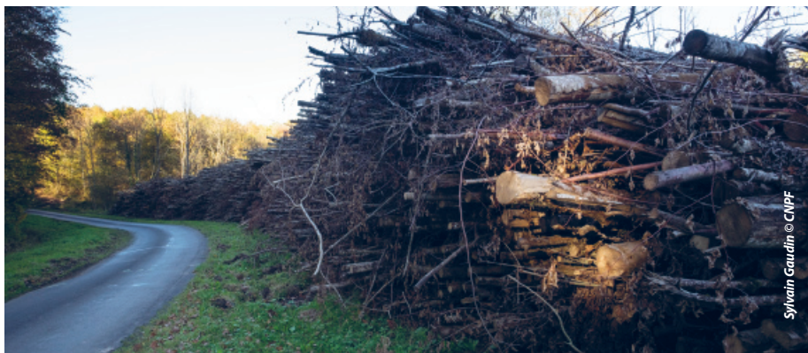
Bois énergie en bord de route avant broyage

Les propriétaires forestiers sont les producteurs de cette matière. Ils participent au développement des énergies renouvelables en fournissant aux chaufferies la biomasse nécessaire : en réalisant des éclaircies, en exploitant partiellement ou totalement des peuplements pauvres pour leur renouvellement et amélioration, en récoltant des peuplements à maturité... ils permettent à la filière bois énergie de fonctionner et de se développer. Jusqu'au début des années 2009, le bois énergie était limité au seul bois bûche. La création et l'essor de la filière plaquettes initiés par le Fonds chaleur se sont substitués au bois de trituration dont les volumes utilisés étaient et sont en baisse régulière.