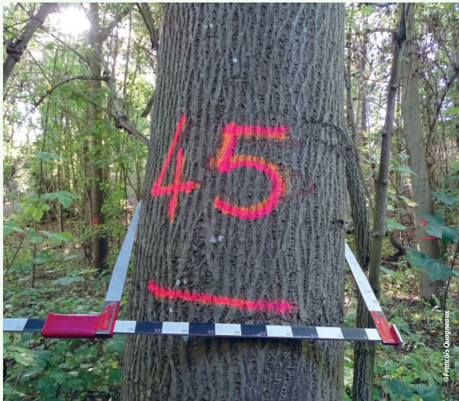
Noyer hybride de 32 ans, diamètre 57,5 cm !

Là encore on n'intervient pas a priori sur le reste du peuplement et les interventions d'éclaircies sont très localisées autour des arbres objectif (« champion »). Pas ou peu de récolte de bois de chauffage avec cette technique, les arbres à éliminer pouvant être annelés pour plus de facilité ou encore cassés par différents moyens : le recours au Sylvacass® sur mini pelle peut être envisagé.