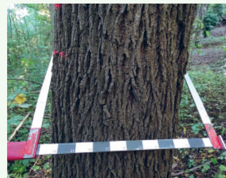
Noyer noir d'Amérique, 32 ans, diamètre 55,9 cm