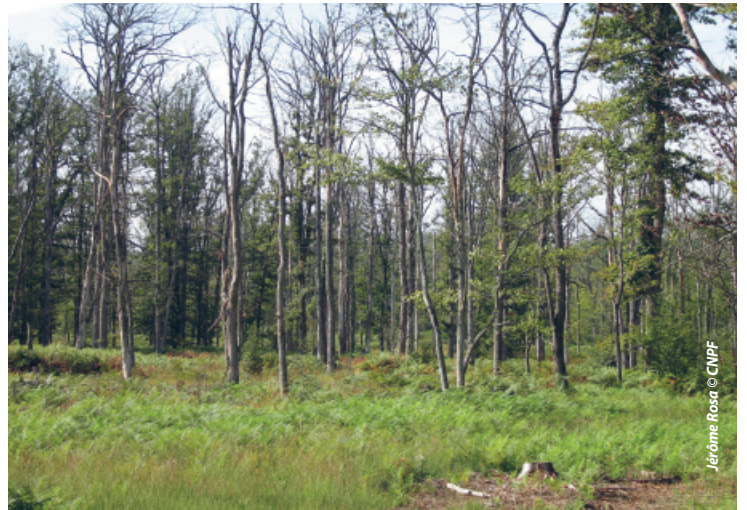
Les dépérissements de chênes pédonculés se multiplient sur les sols qui ne leur conviennent plus

Avec le Plan de relance et autres dispositifs de subvention, la demande en plants augmente fortement et crée des tensions pouvant provoquer des ruptures d'approvisionnement amplifiées par des fructifications aléatoires de certaines essences. Les propriétaires qui souhaitent planter doivent donc désormais réserver leurs plants au printemps précédant l'hiver du projet de plantation, au risque de ne pas pouvoir disposer de la totalité de la commande passée. Quelles recommandations peut-on néanmoins donner sur les choix d'espèces et de provenances ?