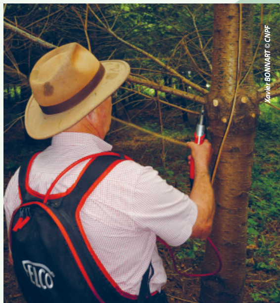
Les sécateurs électriques professionnels facilitent la tâche de taille et élagage

Il faut être très vigilant pour éviter de se blesser avec la lame puissante du sécateur capable de sectionner un doigt. Comme pour la tronçonneuse électrique, le risque de section totale ou partielle du fil reliant batterie au sécateur doit être pris en compte.