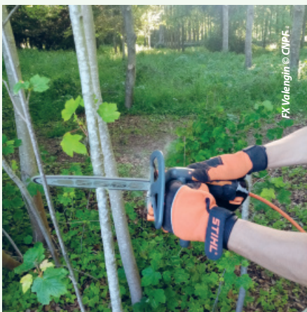
Les tronçonneuses électriques avec batteries déportées sont plus légères

Il s'agit de petits matériels adaptés pour couper des sections et diamètres assez limités qui dépassent souvent les capacités du sécateur sans remplacer les tronçonneuses thermiques plutôt réservées à l'abattage. Très légères, maniables et beaucoup moins dangereuses, elles sont utiles pour l'élagage jusqu'à une hauteur de 2 m, voire au-delà pour les modèles équipés de perches ainsi que la coupe de tiges de petits diamètres jusqu'à 15 à 20 cm selon les matériels.