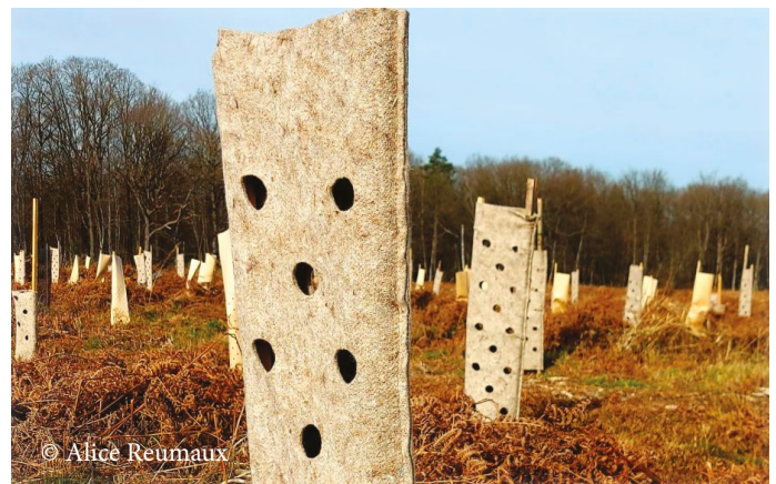
Manchons en laine en plantation forestière

La comparaison de l'efficacité de ces différents dispositifs de protection passe notamment par l'expérimentation : plusieurs Cetef (Centres d'Etudes Techniques et Economiques Forestières) des Hauts-de-France vont ainsi tester en 2024 l'usage des manchons en laine de mouton sur de nouvelles plantations.