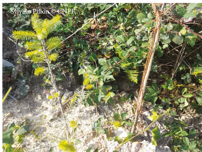
En situation de déséquilibre forêt-gibier, les dégâts compromettent fortement l'avenir des plants (ici frottis sur Douglas)

Savoir identifier les dégâts et les inventorier simplement en parcourant la parcelle est une pratique nécessaire à acquérir lorsque l'on met en œuvre des renouvellements par plantation ou régénération naturelle. Si vous souhaitez vous former, le CRPF, les groupes de progrès (Cetef), les Fogefor et les syndicats Fransylva organisent des formations à la reconnaissance des dégâts, à leur estimation et à leur signalement dans la plateforme.