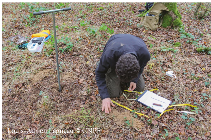
Louis-Adrien Lagneau © CNPF

L'étude des potentialités stationnelles de la parcelle destinée à être plantée est indispensable . L'analyse de sol permet en effet de déterminer les essences les plus adaptées ainsi que de planifier les travaux nécessaires au renouvellement forestier . Profondeur, composition, structure, pH, présence de calcaire dans la terre fine, etc. sont autant de données nécessaires au choix des essences. La nature du sol renseigne également sur sa portance et peut conditionner des périodes d'intervention très spécifiques pour limiter toute dégradation ou tassement.