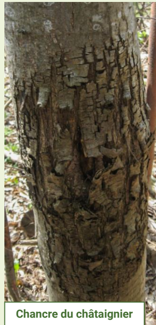
Chancre du châtaignier