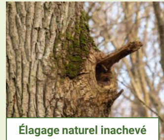
Élagage naturel inachevé