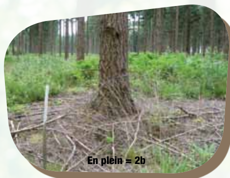
En plein = 2b

Le CRPF cherche à tester différentes techniques ou espèces, observer la réaction des peuplements et analyser leurs résultats. Une référence correspond au suivi de la croissance d'un peuplement pour un climat et un sol donnés, selon une technique sylvicole précise. Une expérimentation , c'est la comparaison de différentes techniques ou espèces sur un même site.