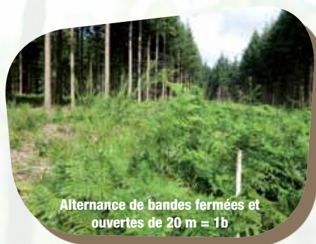
Alternance de bandes fermées et ouvertes de 20 m = 1b