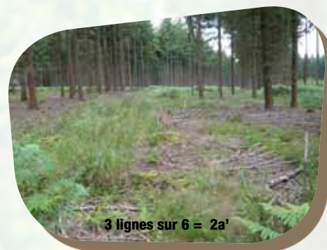
3 lignes sur 6 = 2a'

Comparaison de différentes techniques de régénération du Douglas en plein (2b), par bandes ouvertes de 20 m (1b), en plein avec l'exploitation de 3 lignes sur 6 (2a').