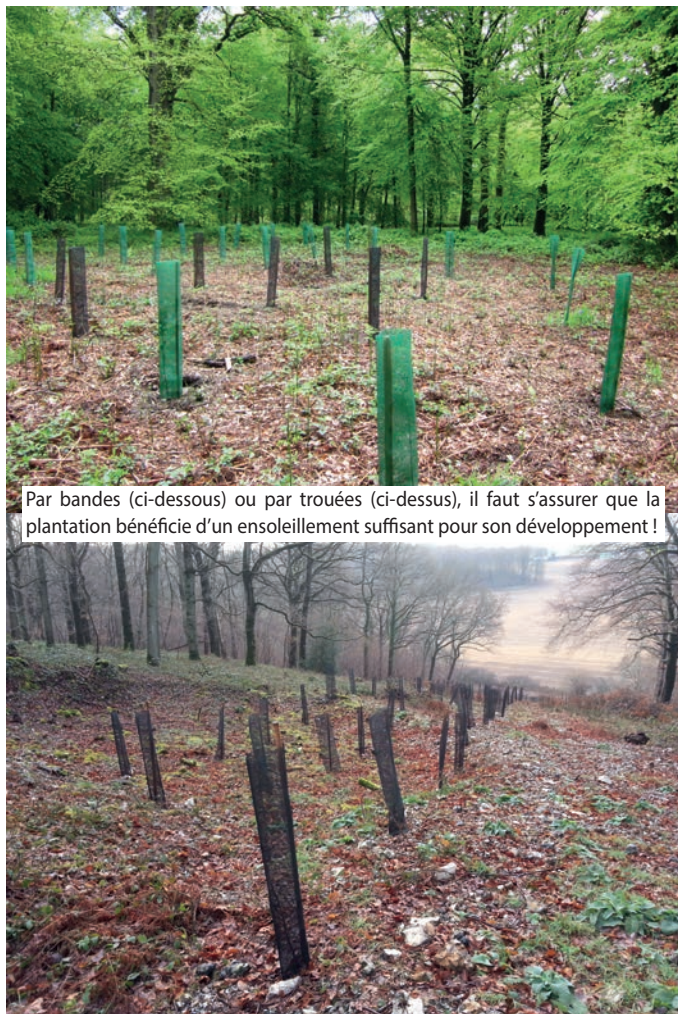
Par bandes (ci-dessous) ou par trouées (ci-dessus), il faut s'assurer que la plantation bénéficie d'un ensoleillement suffisant pour son développement !