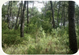
Une pinède dans les dunes du Marquenterre