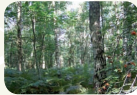
Une chênaie-boulaie sur un sol sableux du Cambrésis