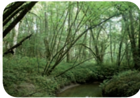
Une forêt alluviale dans le Boulonnais