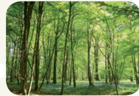
Une hêtraie-chênaie sur un sol limoneux de l'Artois