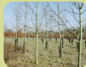
Un boisement d'une terre agricole

▲ Fiche C4. Les haies, bandes boisées et l'agroforesterie